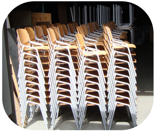
Heel veel stoelen