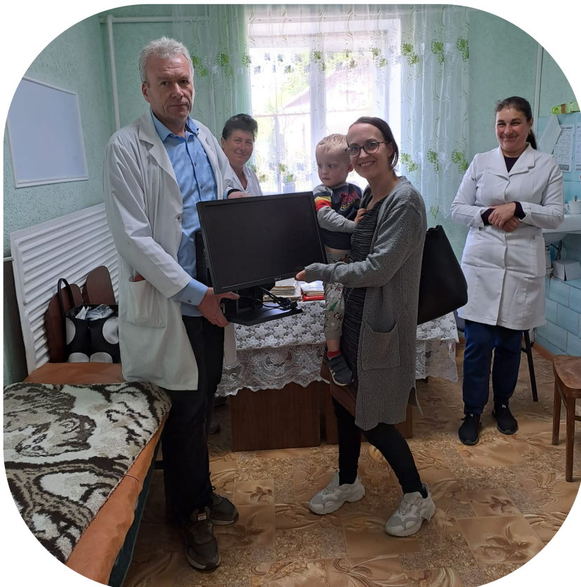
Zending overhandigd computers

Tot nu toe was altijd enkel op papier gewerkt. “We hebben 3 computers nodig en 2 printers, want we moeten ons werk digitaliseren, alleen daar hebben we geen apparatuur voor.” Gelukkig konden we helpen. We hebben de computers geïnstalleerd in de Roemeense taal en alles stevig ingepakt in 6 grote dozen. Die zijn meegegaan met een Hulptransport naar Moldavië en uiteindelijk goed aangekomen bij de huisartsenpost.