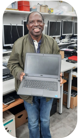
Laptop voor YWAM-er

Bij Stichting Hand proberen we die zendingen te helpen. Met spullen voor op het zendingsveld zoals bijvoorbeeld computers voor het ziekenhuis dat de zending gaat opzetten. Door gereviseerde computers aan de zending mee te geven, kan apparatuur geregeld worden die in het land zelf soms onbetaalbaar is. Ook bij terugkomst voor verlof is vervoer voor de zending erg belangrijk. Vandaar dat er bij ons auto's te lenen zijn voor die periode. Vaak weten de zendingen ons dan ook te vinden voor een warme jas of een tweede koffer voor de terugreis.