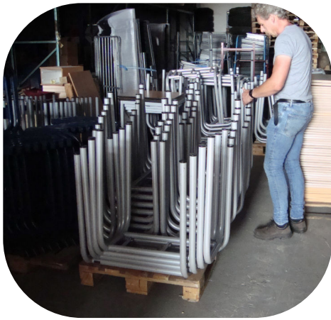
Tafels goed gestapeld