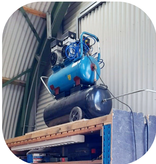
Compressor in Roemenië

In Roemenië was een verzoek voor een compressor in een werkplaats van een kerk. De compressor die we beschikbaar hadden had een te kleine opslag capaciteit. Er was nog een tweede tank beschikbaar. Aart heeft die er extra op gebouwd door ze met beugels aan elkaar te lassen en de buizen door te koppelen. Het eindresultaat zie je hiernaast in de loods in Roemenië.